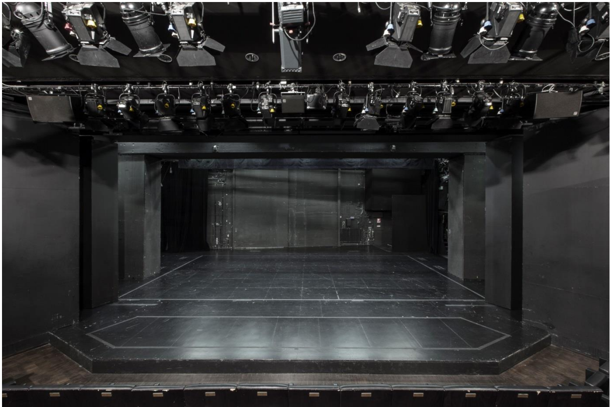
Blick auf die Bühne mit ungerader Bühnenkante. Die Bühnenecken sind ausgebaut und je zwei Sitze in Reihe 1 außen sind eingebaut.