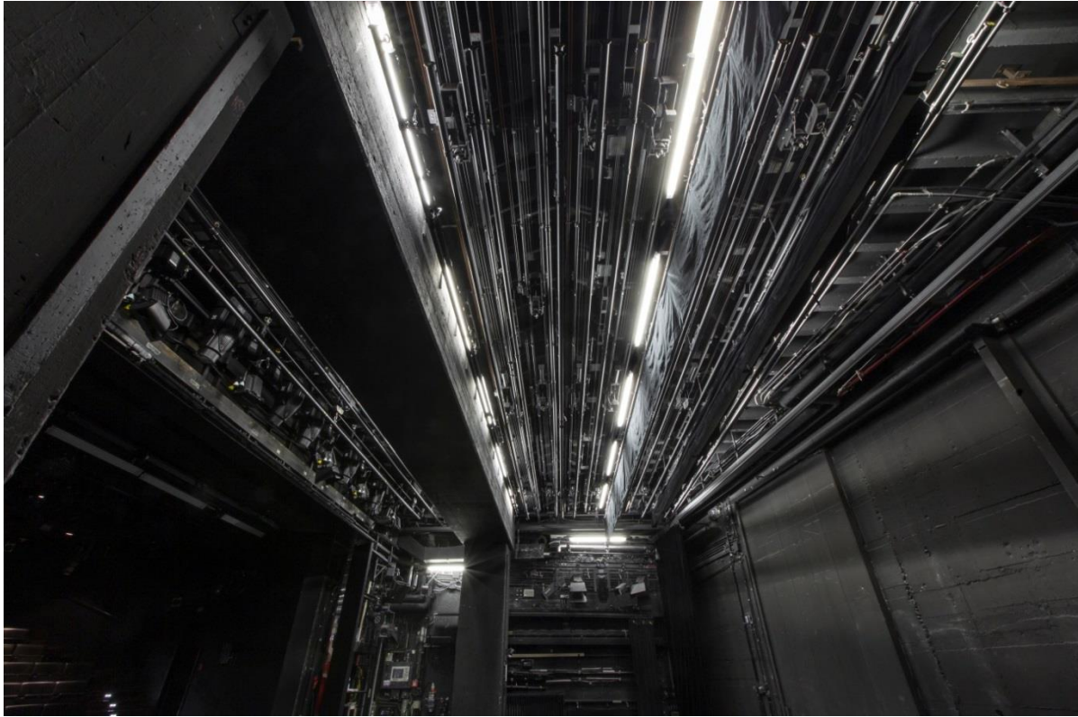
Blick in die Obermaschinerie