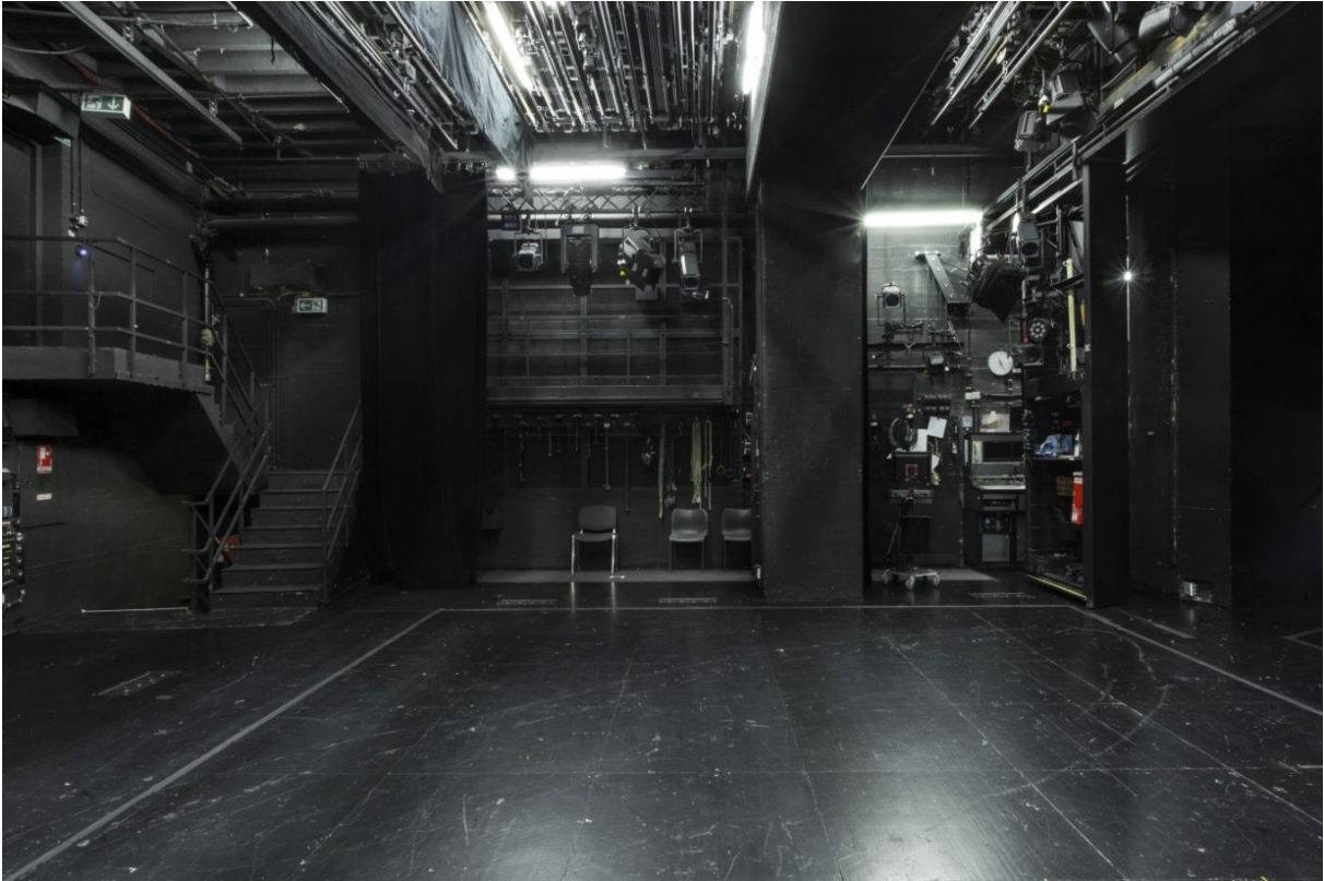
Bühne rechte Seite