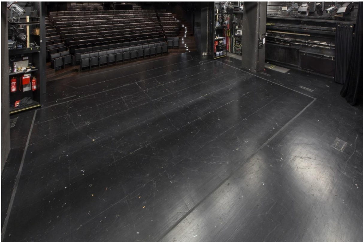
Blick auf den Bühnenboden mit sichtbarer Rasterung der Eindecktafeln