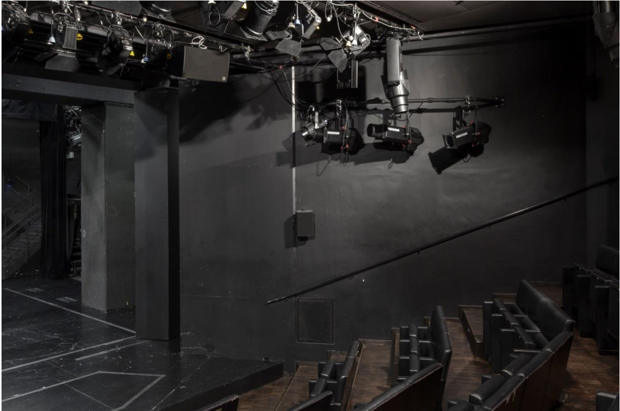
Zuschauerraum rechte Seite