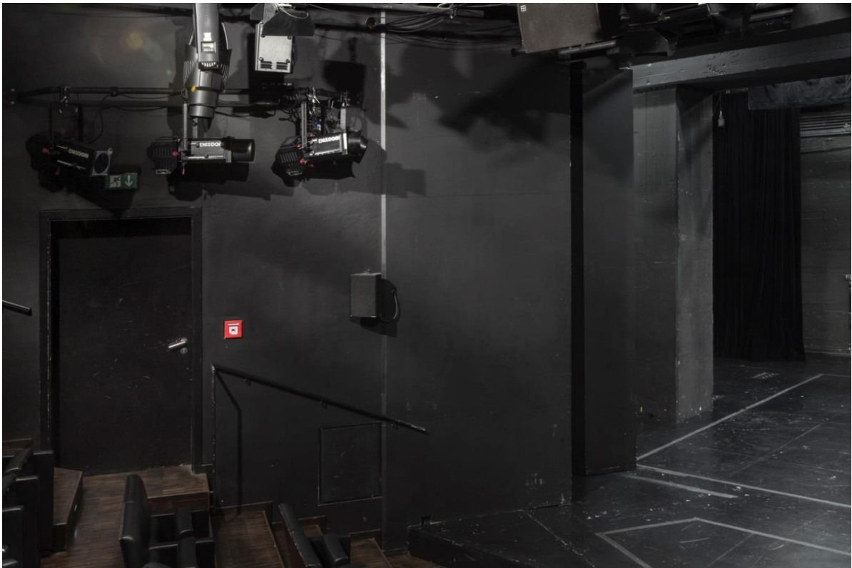
Zuschauerraum linke Seite