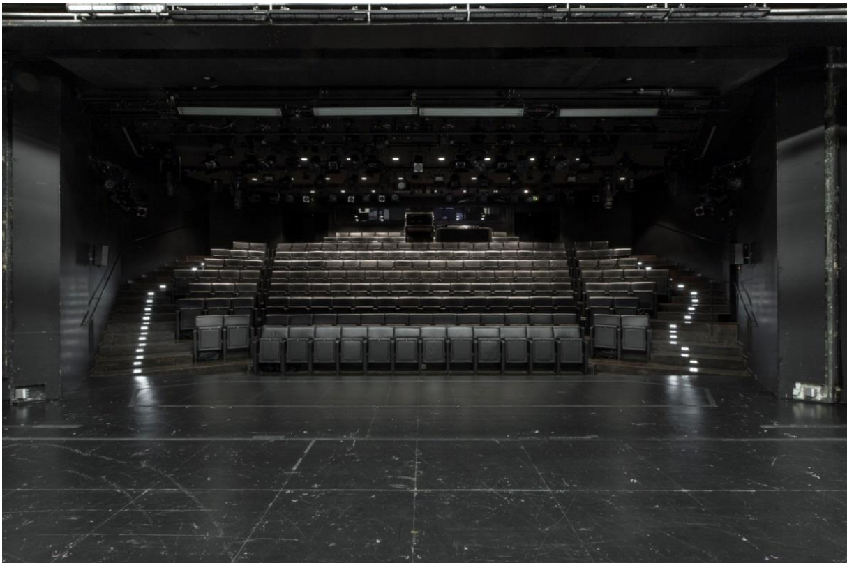
Blick in den Zuschauerraum mit gerader Bühnenkante. Die Bühnenecken sind eingebaut und je zwei Sitze in Reihe 1 außen sind ausgebaut.